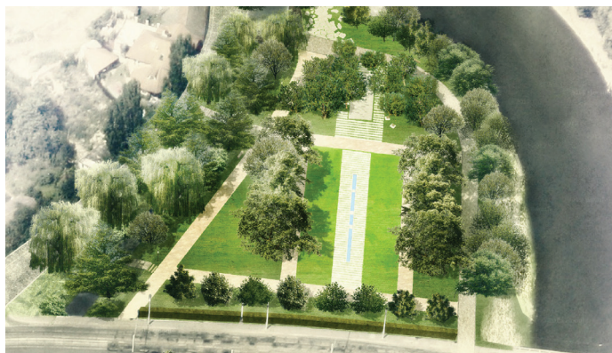
Obnova Tyršova parku