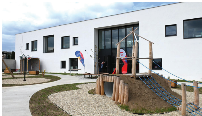
Nová trojtřídní mateřská škola