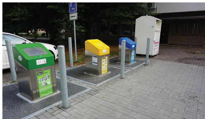
Podzemní kontejnery na SNP