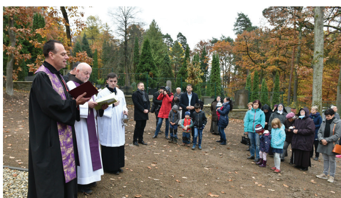
Nově rozšířený lesní hřbitov