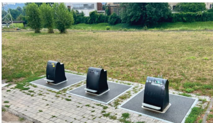
Podzemní kontejnery na Svitavském nábreží