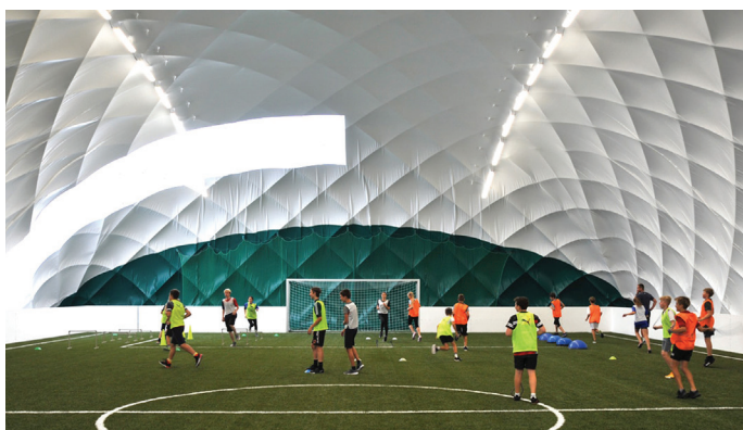
Nové sportovní haly ZŠ Janouškova