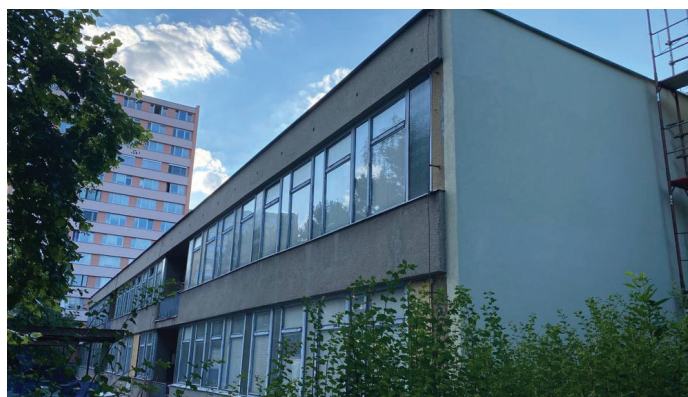
Zachráněna statika školky na Loosově