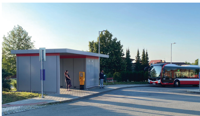
Nová zástávka na konečné