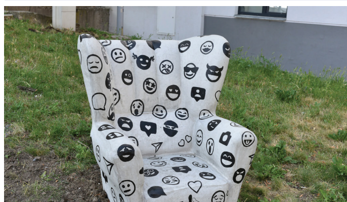
Křesla na Svitavském nábreží