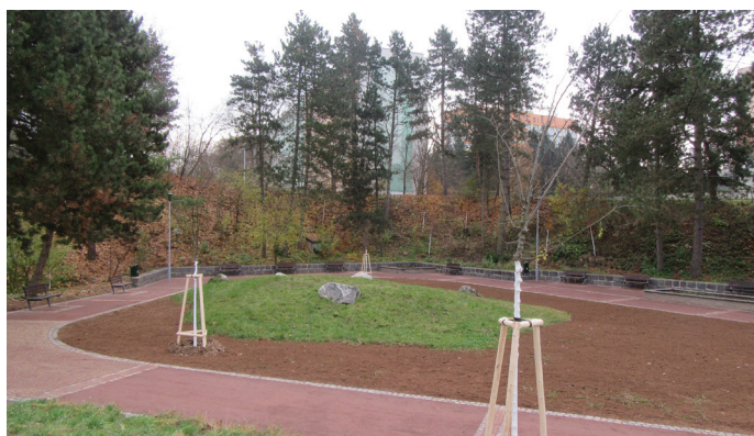
Revitalizace části Čertovy rokly