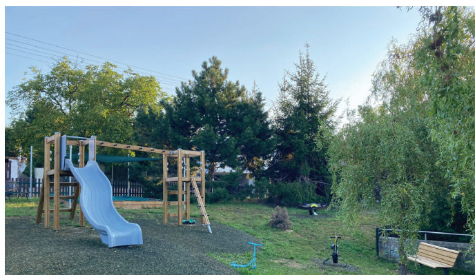
Nové hřiště na Síčce