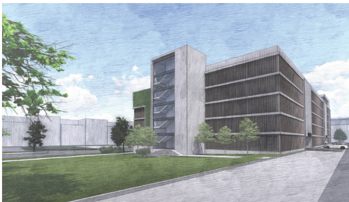
Nový parkovací dům u Polikliniky