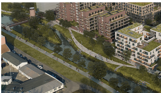
Revitalizace nábřeží Svitavy vizualizace: Nová Zbrojovka, CPI, a.s.