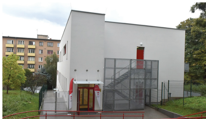
Nová školka Sýpka