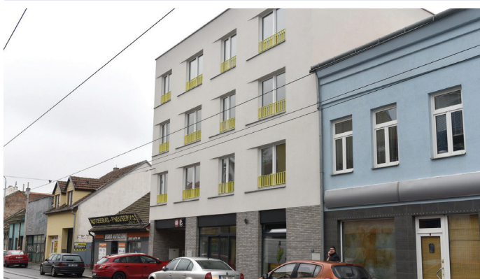
Nová budova pošty