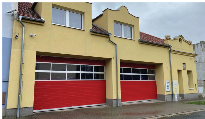
Opravená husovická hasička