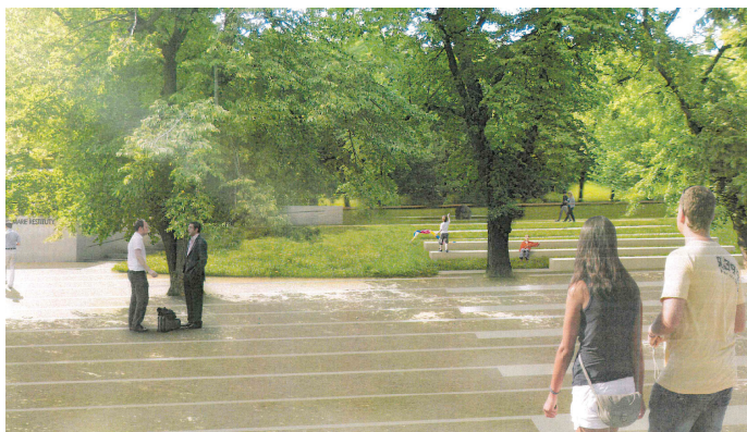
2. etapa revitalizace parku Marie Restituty