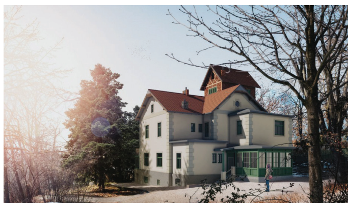
Opravená Arnoldova vila s parkem