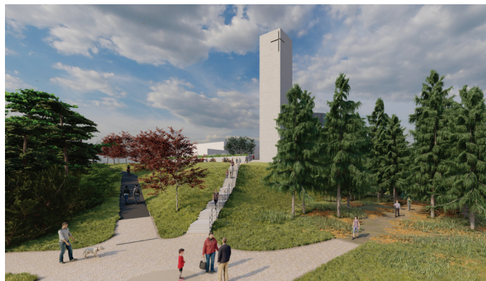
Nové schody ke kostelu na konečné 9