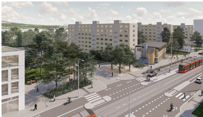
Nový park na konečné 5 vizualizace: Kancelář architekta města