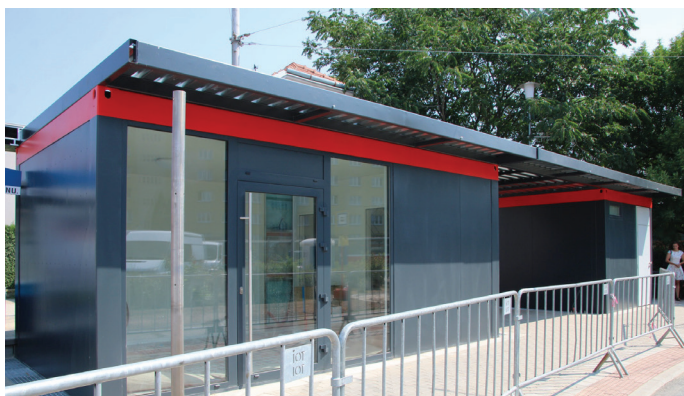
Nová zástávka ve Štefánikově čtvrti