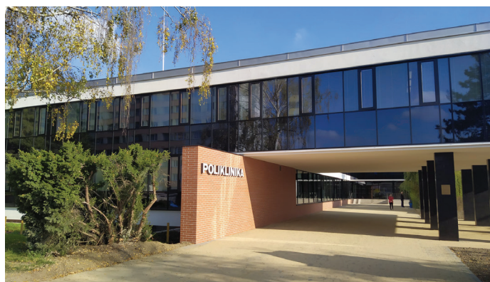
Kompletně opravený plášť Polikliniky Lesná