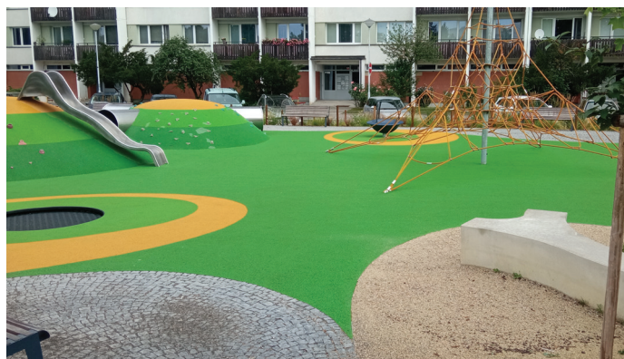
Nové hřiště Brechtova