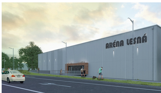
Sportovní hala u nádraží Lesná vizualizace: Hattrick FBŠ