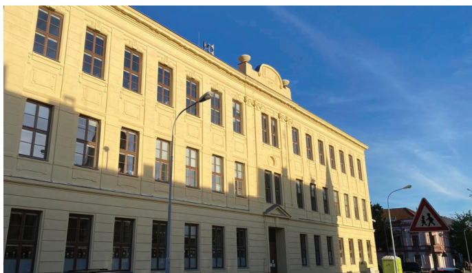
Opravená škola na náměstí Republiky