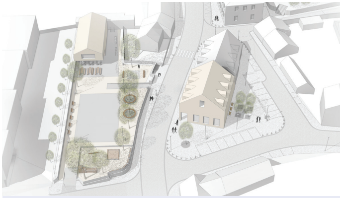
Nové centrum Soběšic