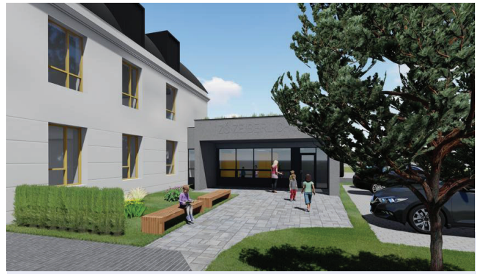
Nové šatny v základní škole