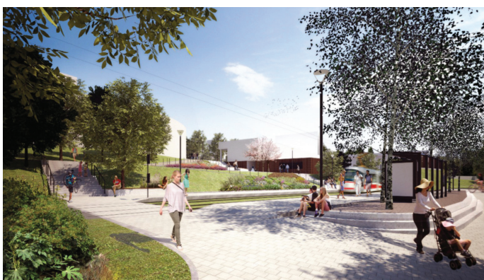
Revitalizace Halasova náměstí