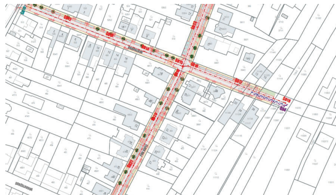
Rekonstrukce ulic Dohnalova a Pod kaplí