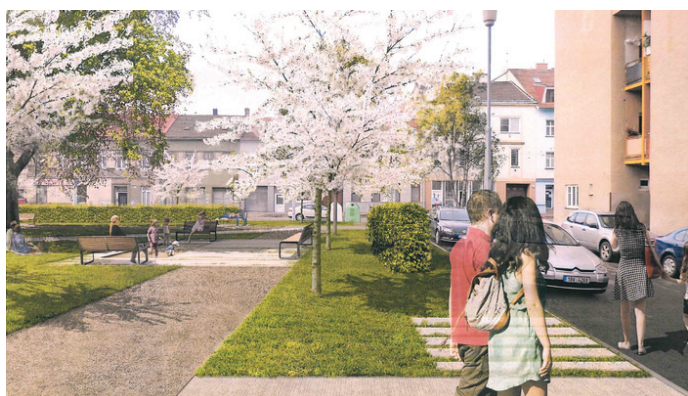
Obnova parku u vozovny Husovice