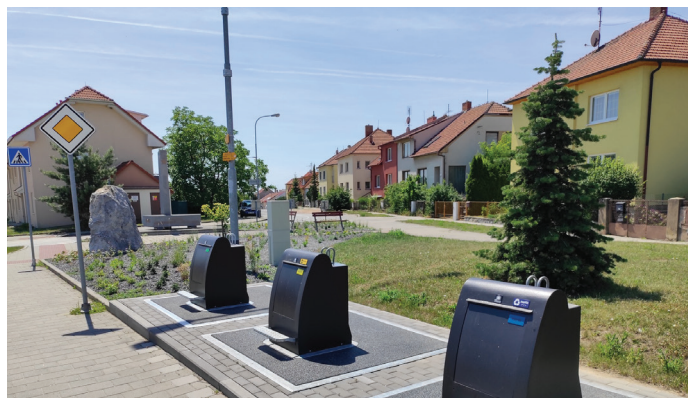
Nové podzemní kontejnery