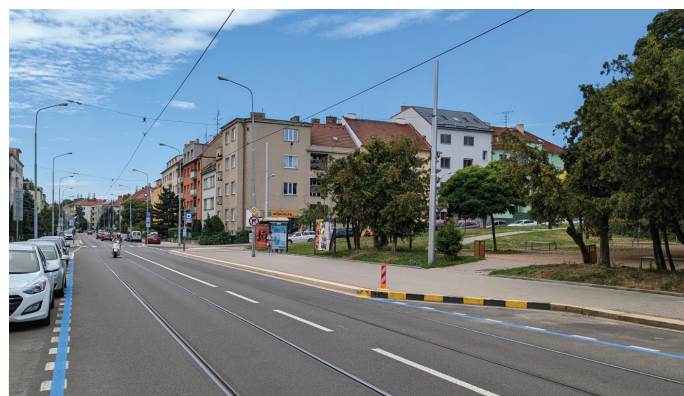
Opravená Merhautova ulice