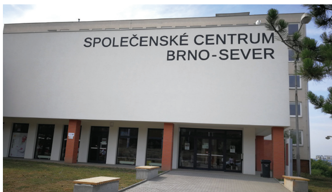
Nově opravené Společenské centrum s Family/Senior pointem