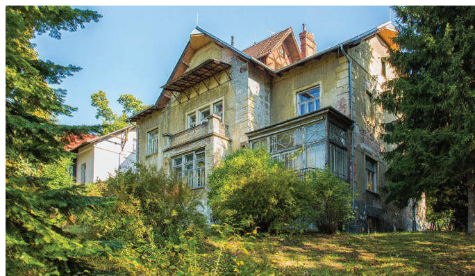
Začala oprava Arnoldovy vily