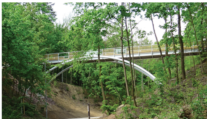
Nová lávka v Čertově rokli